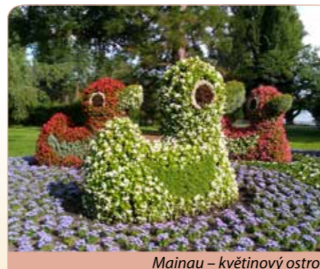
Mainau – květinový ostrov

Snídaně v hotelu, celodenní výlet do oblasti Bodamského jezera, druhého největšího jezera v Alpách. Návštěva rakouského města Bregenz. Procházka u jezera v hlavním městě Vorarlberska, oblast kultury a moderní architektury, největší jeviště světa, které se nachází na vodní hladině a kde se odehrávají letní kulturní festivaly. Přejezd po švýcarské jižní straně jezera mezi vinohrady a ovocnými sady se zastávkou v mės-