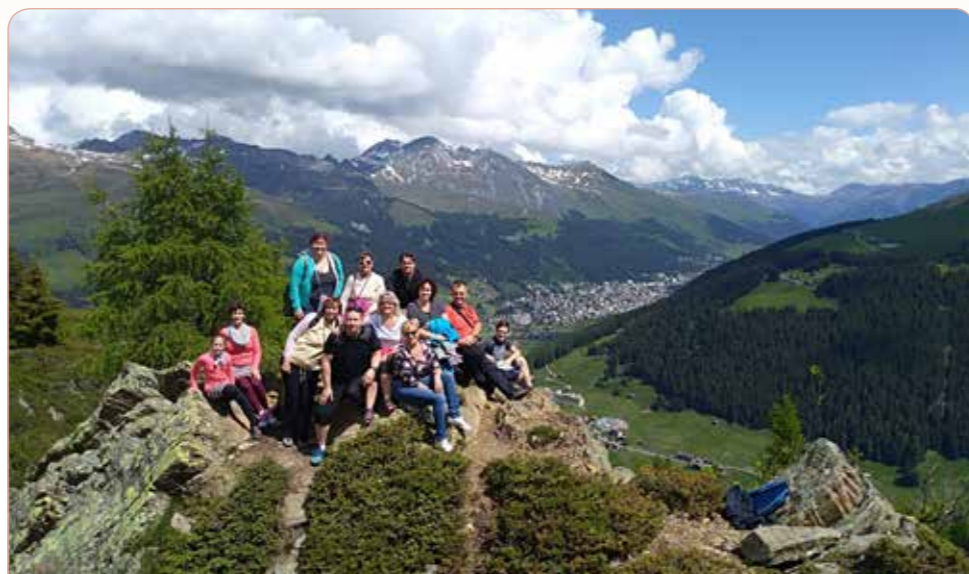
Davos - vyhlídka v okolí Rienerhorn

damského jezera. Návštěva středověkého historického centra s nejatraktivnější částí přístavu s kouzelnou atmosférou, s monumentem lva a vysokým majákem. Večerní pozornost, dojezd na ubytování.