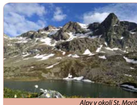
Alpy v okolí St. Moritz