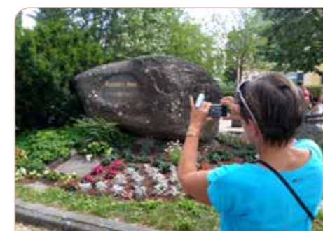
Kostnice - místo upálení našich protestantů

Po snídani v hotelu přejezd do Lichtenštejnského knížectví. Procházka v hlavním městě Vaduz, centrum města s dominantním knížecím zámekem, sídlem panovníka. Vedle nových moderních budov si město zachovalo i historické, pečlivě udržované rodinné domy, farní kostel sv. Floriána, Poštovní muzeum s historií filatelie, muzea umění, galerie, obchodní zóny. Polední pozornost. Přejezd přes bavorské Německo, hraničním přechodem Rozvadov návrat do České republiky. Příjezd do Prahy a Hradce Králové ve večerních hodinách.