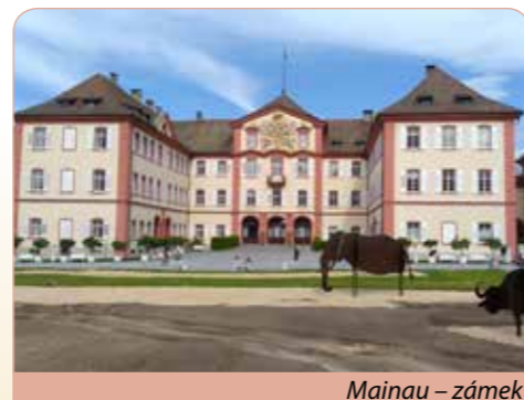
Mainau – zámek

Snídaně v hotelu, celodenní výlet do jedinečného přírodního kantonu ve Švýcarsku – Graubündenu. Zastávky k poznání významných turistických středisek a klimatických lázní Davos a St. Moritz, která patří k nejznámějším a nejluxusnějším švýcarským střediskům a centrům zimních sportů. Davos je světoznámé středisko významných vědeckých i politických kongresů (např. Světové ekonomické fórum). Horské lázně St. Moritz a přilehlé údolí Engadin jsou v létě rušným místem plným výletníků a lázeňských hostů. Sportovce zaujme, že se zde konaly zimní olympijské hry v letech 1928 a 1948 a bylo zde v roce 2017 mistrovství světa v alpském lyžování. Polední pozornost. Obě města jsou umístěna v idylické krajině a nabízejí vše, co si turisté od Alp přejí – možnost výjezdu lanovkou, nenáročnou turistiku dle fyzické zdatnosti v okolí, panoramatické výhledy na úchvatné vrcholky světoznámých hor. Večere samostatně, návrat na stejné ubytování.