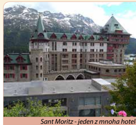
Sant Moritz - jeden z mnoha hotelů