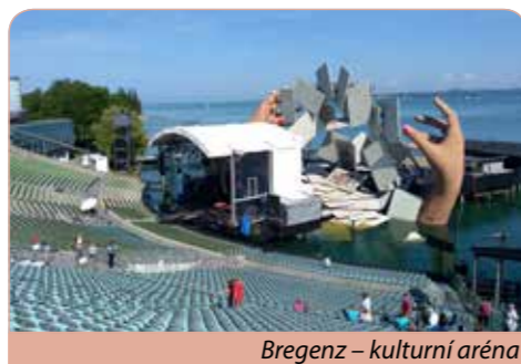
Bregenz – kulturní aréna

damského jezera. Návštěva středověkého historického centra s nejatraktivnější částí přístavu s kouzelnou atmosférou, s monumentem lva a vysokým majákem. Večerní pozornost, dojezd na ubytování.