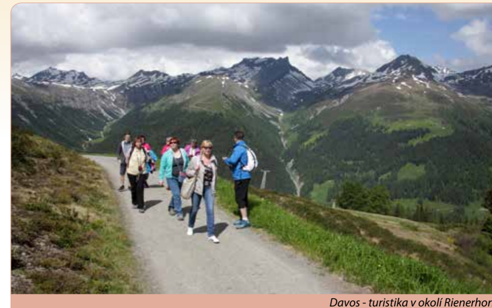
Davos - turistika v okolí Rienerhorn

tečku Rorschach, osobní volno s možností prohlídky umělecké sbírky firmy Würth. Odpolední návštěva historické Kostnice, největšího města u Bodamského jezera. Procházka zachovalým středověkým centrem a místy, kde se v letech 1414 až 1418 konal kostnický koncil, který rozhodl o upálení Jana Husa a Jeronýma Pražského. Polední pozornost. Následně pobyt na „květinovém“ ostrově Mainau, který je soukromým vlastnictvím rodiny Bernadottů spřízněné se švédskou korunou. Dokonalá harmonie zahradnické architektury v jednom z nejkrásnějších evropských parků, prohlídka mnoha krásně upravených záhonů hrajících všemi barvami, části barokního zámku a skleníků. Večere samostatně, návrat na stejné ubytování.