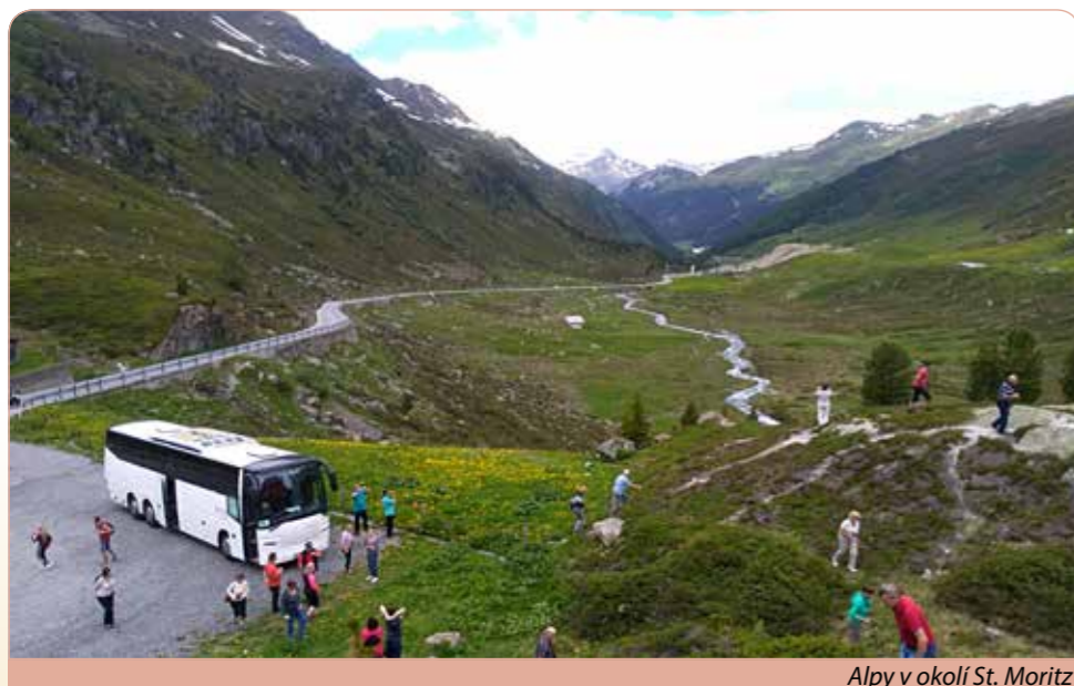
Alpy v okolí St. Moritz

Odjezd z Hradce Králové v 7.00 hodin, možnost nástupu v Chlumu nad Cidlinou, v Poděbradech, v Praze (Černý Most) a v Plzni. Přejezd přes německé Bavorsko do jihozápadního cípu, do města Lindau u Bo-